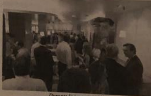
Durante la inauguración